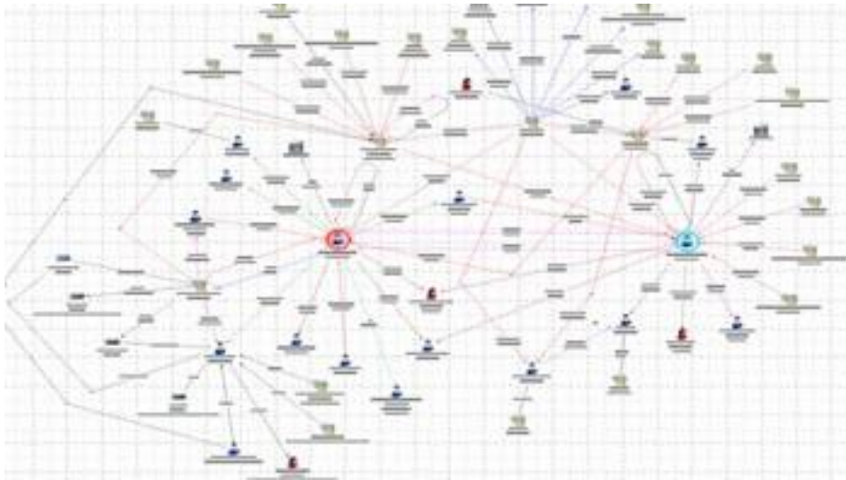
Ex på svart arbetskraftshärva

Vägledningen beskriver vilka uppgifter och vilken hjälp som du som inköpare av tjänster kan få av myndigheter, (bransch och arbetsmarknadens parter) när du kontrollerar dina leverantörer. Den beskriver även vad som kan känneteckna ett oseriöst företag och vilka registreringar som du kan förvänta dig. Verkligheten och nätverken kan ibland vara väldigt komplexa att överblicka utan hjälp.